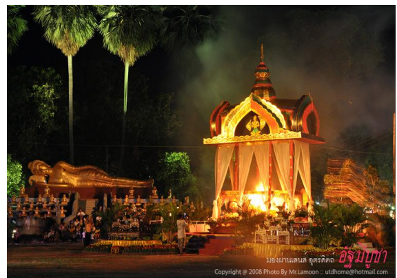
บรรยากาศการจัดงานอัฐมีบูชา ณ วัดพระบรมธาตุทุ่งยั้ง