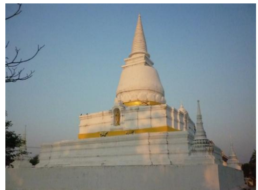
พระบรมธาตุหลังการบูรณะในปัจจุบัน