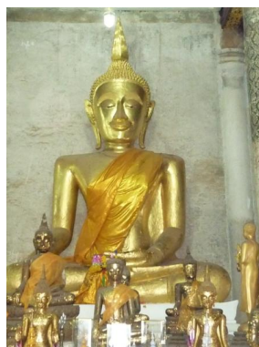
หลวงพ่อดอกเมือง

พระประธานซึ่งประดิษฐานอยู่ภายในวิหารเป็นพระพุทธรูปศักดิ์สิทธิ์คู่เมืองทุ่งยั้ง เป็นพระพุทธรูปปูนปั้นขนาดหน้าตักกว้าง 2 วา 10 นิ้ว สูง 3 วา 10 นิ้ว ลงรักปิดทองคำเปลวอย่างดี ชาวบ้านถวายนามว่า “หลวงพ่อดอกเมือง” บ้าง “หลวงพ่อดอก” บ้าง และโดยที่พระพักตร์ของพระประธานมีลักษณะดูราวกับว่าสูงอายุมาก ชาวบ้านจึงมักนิยมเรียกว่า “หลวงพ่อดอกพระชานเฒ่า”