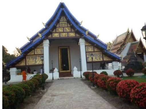
วิหารพระบรมธาตุทุ่งยั้ง