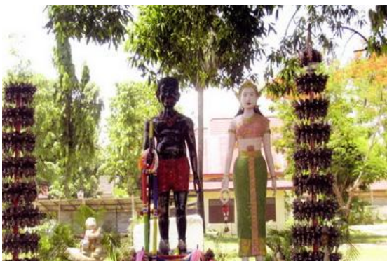
รูปปั้นเจ้าเงาะคู่จวนหลังวิหารพระบรมธาตุทุ่งยั้ง

และมาภายหลังได้ทราบจากพระยาอุทัยมนตรี ว่าได้ไปตรวจค้นพบกำแพงเมืองมีต่อลงไปอีกจนถึงลำน้ำ แคก็เป็นคำบอกเล่า ข้าพเจ้าสันนิษฐานอย่างอื่นต่อไปอีกยังไม่ได้ จนกว่าจะได้ขึ้นไปเห็นด้วยตนเอง....."