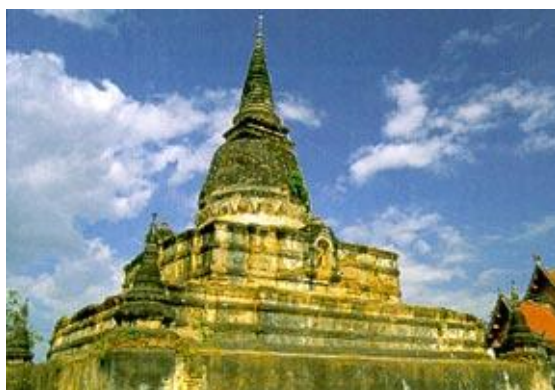
พระบรมธาตุ ก่อนการบูรณะ ปี 2550

เจดีย์ประธานเป็นเจดีย์ทรงระฆัง ฐานสี่เหลี่ยม กว้าง 22.20 เมตร ยาว 22.20 เมตร สูง 25 เมตร ประกอบด้วยฐานเชิงซ้อนกัน 3 ชั้น ลดหล่นกันไป ฐานชั้นล่างสุดก่อด้วยศิลาแลง ถัดขึ้นไปก่อด้วยอิฐและ ศิลาแลง ฉาบด้วยปูน ที่ฐานเชิงชั้นล่างทั้ง 4 มุม มีเจดีย์ขนาดเล็กทรงระฆัง ตรงกลางเรือนธาตุของเจดีย์ ประธานทั้ง 4 ด้าน ประดิษฐานพระพุทธรูปปางประทับยืนอยู่ภายในซุ้มจรนำ เล่ากันว่าเจดีย์ประธานนี้ แต่เดิม มียอดสูงสวยงามมาก แต่ได้เกิดหักลงมาเมื่อคราวเกิดแผ่นดินไหวครั้งใหญ่ วันที่ 12 พฤศจิกายน พ.ศ.2451 ต่อมาหลวงพ้อแก้วได้ร่วมกับชาวบ้านบูรณปฏิสังขรณ์ขึ้นใหม่