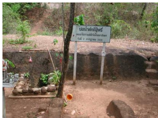
บริเวณคูเมืองเวียงเจ้าเงาะ