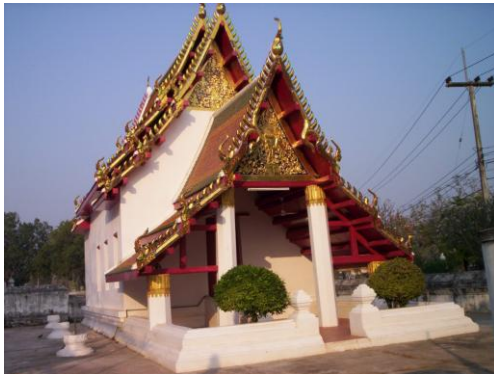
อุโบสถที่ทำการบูรณะแล้วเสร็จใหม่

อุโบสถ เป็นอุโบสถขนาด 3 ห้อง ก่ออิฐถือปูน กว้าง 7.60 เมตร ยาว 18 เมตร สูง 13 เมตร ผนังด้านข้างมีช่องหน้าต่างด้านละ 3 ช่อง หลังคามุงกระเบื้องลด 3 ชั้น ประดับด้วยช่อฟ้า ใบระกา หางหงส์ ปูนปั้นประดับกระจก ด้านหน้าเป็นมุขยื่นหลังคาลด 3 ชั้น ภายในประดิษฐานพระพุทธรูปประธานปูนปั้น