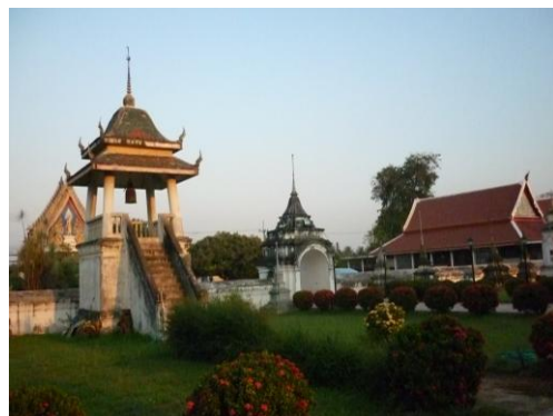
หอรระฆังและศาลาการเปรียญ

วิหาร เป็นวิหารขนาด 5 ห้อง ตั้งอยู่ด้านทิศตะวันออกของเจดีย์ประธาน ก่อด้วยศิลาแลงและอิฐ มีขนาดกว้าง 10.50 เมตร ยาว 25 เมตร สูง 13.70 เมตร หลังคามุงกระเบื้องลด 3 ชั้น ประดับด้วยช่อฟ้า ใบระกา หางหงส์ไม้แกะสลัก หน้าบันเป็นไม้แกะสลักติดกระจกลดรักปิดทอง มีมุขทั้งด้านหน้าและด้านหลังทำเป็นหลังคาลด 3 ชั้น เสารับน้ำหนักด้านนอกเป็นเสาสี่เหลี่ยมขนาดใหญ่ หัวเสาเป็นบัวกลุ่ม มีหน้าต่างด้านละ 5 บาน ด้านหน้ามีประตู 1 ประตู ด้านหลังมี 2 ประตู ภายในมีฐานชุกชีประดิษฐานพระพุทธรูปปูนปั้นปางมารวิชัย ด้านหน้าพระประธานมีเศวตฉัตรหัวเสาเป็นบัวกลุ่มรับน้ำหนัก เพดานเป็นลายเขียนสี และที่ผนังด้านในมีภาพจิตรกรรมฝาผนังซึ่งเคยเป็นที่เลื่องลือว่างดงามมาก ที่ผนังด้านหน้าเหนือระดับประตูเป็นภาพเกี่ยวกับพุทธประวัติตอนผจญมาร ส่วนที่ผนังด้านข้างตอนบนที่ติดกับหลังคาเขียนเป็นภาพเทพชุมนุม และตอนล่างเป็นภาพเขียนวรรณคดีเรื่องสังข์ทอง ซึ่งปัจจุบันลบเลือนมาก