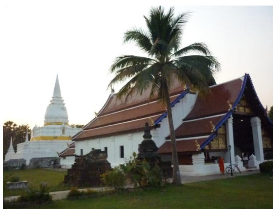
พระบรมธาตุตั้งอยู่หลังวิหาร